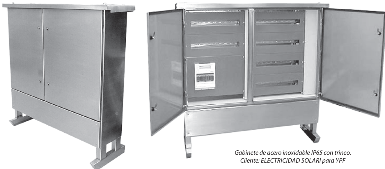
Gabinete de acero inoxidable IP65 con trineo. Cliente: ELECTRICIDAD SOLARI para YPF

Ej. de codificación: Para un gabinete de 600 x 1500 x 150 con puerta ciega es: NIX I 600.1500.15C