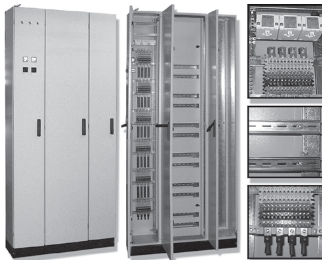
Tablero de Distribución con Ducto para Electricidad Alsina

El ducto: Se utiliza para colocar la barra de tierra, los bornes de acometida y los bornes de salida. En algunos casos se puede hacer que el riel sea solidario al kit de montaje, permitiendo hacer todo el cableado interno fuera del gabinete para luego instalarlo. También puede colocarse una bandeja y hacer diferentes montajes. A pedido el ducto puede ir a la izquierda del gabinete, o se pueden fabricar combinaciones con más de un ducto.