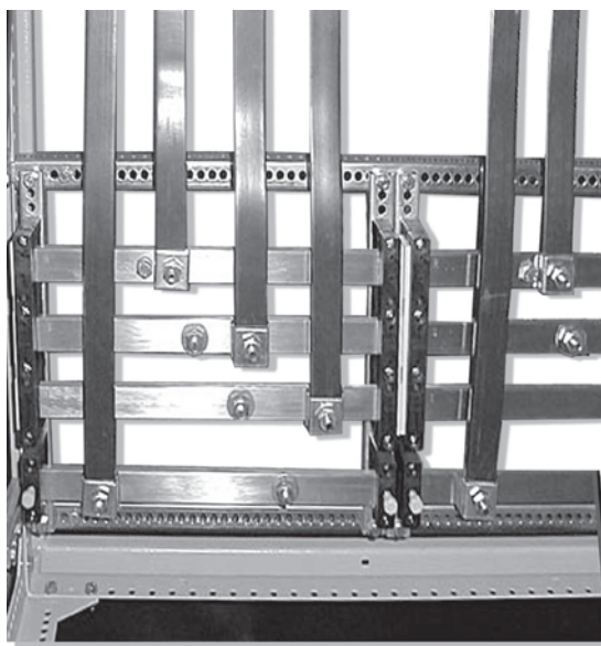
Gabinete Nöllek con dos buses de barras HD54310