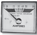
Mod. 75 5 a 200 AD