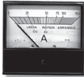
Mod. 86 100 a 200 AD