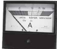
Mod. 118 100 a 500 AD